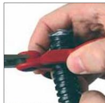
Ganasce serratubo per tubi corrugati