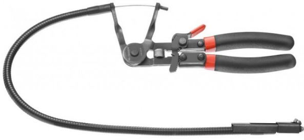
FACOM DM - MUB